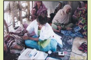
گاؤں میں جینیٹریز اور موبائل الرٹا ساؤنڈ کی بدولت الرٹا ساؤنڈ کی سہولیات