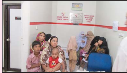
زنانہ امراض اور پیکینسی کے متعلق آگاہی اور الٹراساؤنڈ کے رجسٹریشن کے لئے غریب خواتین انتظار کر رہی ہیں