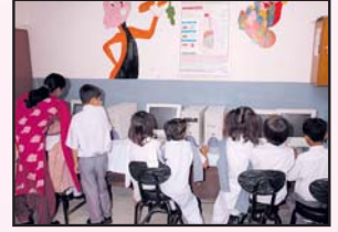
پرائمری اسکول میں بچوں کو کمپیوٹر ٹینگ دی جا رہی ہے