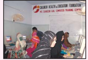
شاہ فیصل کالونی میں ایک مکمل ہیلتھ کیئر سینٹر کے ساتھ کمپیوٹر ٹینگ سیکشن کا ایک منظر

ہمیں آپ کو بتاتے ہوئے خوشی محسوس ہوتی ہے کہ آپ کی زکوٰۃ اور مالی امداد سے غریب اور نادار مریضوں کو ہمارے ۳۹ مستقل اور موبائل ہیلتھ سینٹرز کے ذریعہ ۱۴۲ ملٹی، تعلیمی اور دیگر سہولیات فراہم کر رہی ہے۔ ملٹی سہولیات میں تشخیص لیبارٹری ٹیسٹ، الٹراساؤنڈ عورتوں اور بچوں کی مخصوص بیماریاں (MCH) اور دوائیوں کی مفت فراہمی شامل ہے۔ آٹھ سال کے مختصر عرصے میں CHAEF کے قائم کردہ مراکز سے ۸۳ لاکھ سے زیادہ غریب اور نادار مریض مستفید ہو چکے ہیں۔ اس کے علاوہ CHAEF کے قائم کردہ اسکولوں میں بچہ تعلیم کے علاوہ کمپیوٹر ٹینگ اور انگریزی زبان پر خصوصی توجہ دیکر ان غریب کچی آبادیوں کے بچوں کو بہتر اور کارآمد شہری بنانے کی کوششیں کی جاتی ہے۔ آپ سے گزارش ہے کہ CHAEF کو غریب اور ناداروں کو ملٹی اور تعلیمی سہولیات جاری رکھنے اور مزید سہولیات فراہم کرنے کے لئے دل کھول کر زکوٰۃ، خیرات، صدقہ کے ذریعہ مالی مدد فرمائیں۔