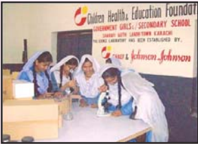
میٹرک کی طالبہ پریکٹس کرنے میں مصروف لیبارٹری چاف نے قائم کی