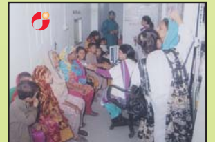
OPD کا منظر جہاں مریضوں کو ڈاؤن اور آنکھوں کا معاشہ پہلے ہوتا ہے