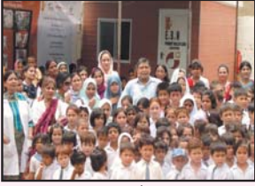
EBM پرائمری اسکول ڈسکمیون کے بعد گروپ فوٹو