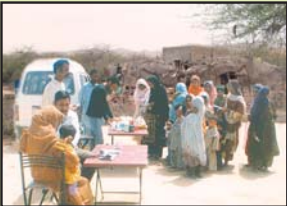
بلوچستان کے ایک گاؤں میں ہیلتھ سروسز