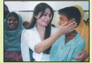
پاکستان کی مشہور فلمی اداکارہ ریمما خان چاہ کے ہیلیتھ سینٹر میں لاہور میں ایک غریب بچے کو گود میں اٹھانے ہوئے