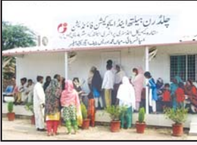
ستارہ کیمیکل ہیلتھ سینٹر فیصل آباد میں مریض اپنی باری کا انتظار کر رہے ہیں