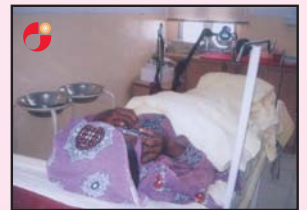
مہلی حاملہ خاتون چاف مدراہنڈ چائلڈ ہیلتھ سینٹر میں