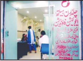
لاہور گلبرگ پرائمری ہیلتھ ایئر اسٹیشن سینٹر