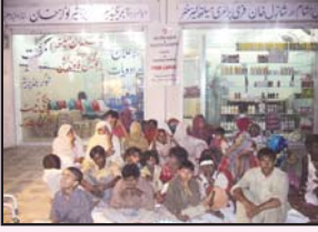
جوہر ٹاؤن لاہور ہیلتھ کیئر سینٹر میں مریض اپنی باری کا انتظار کر رہے ہیں