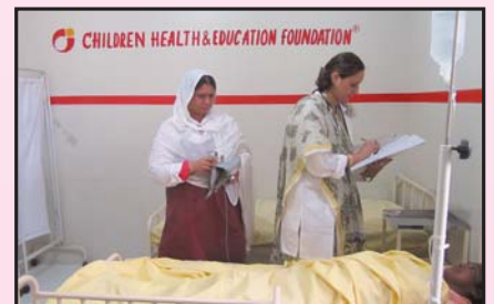
ڈاکٹر گانے کا لوجسٹ میڈیکل وارڈ میں داخل مریضہ کی فائل میں اسپتال ریمارکس لکھ رہی ہیں