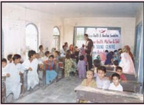
بلوچستان کے ایک گاؤں میں چاف کی مدد سے بچے تعلیم حاصل کر رہے ہیں