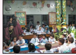
اسکول میں نجائش نہ ہونے پر بچے گن میں تعلیم حاصل کر رہے ہیں