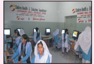
شرفی کوٹھ گڑھی میں سینکڑوں گریڈ اسکول میں کمپیوٹر سیکشن کا ایک منظر