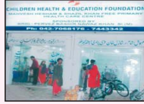
اسٹیٹ آف دی آرٹ سینٹر ایکسپولہ پورہ کے سامنے