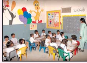
گلستان جوہر کراچی میں زمری کے بچے تعلیم حاصل کر رہے ہیں