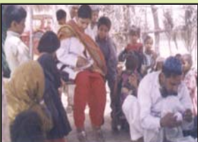
جمہوریہ کیلیک مختلف گاؤں میں موبائل میڈیکل وین کی بدولت