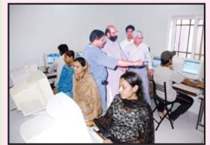
جی انجینئر مائٹا آرٹس قوم آباد کے کمپیوٹر سینٹر کے دورے پر