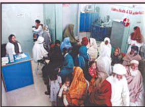
لاہور ہیلتھ کیئر سینٹر میں مریض اپنی باری کا انتظار کر رہے ہیں