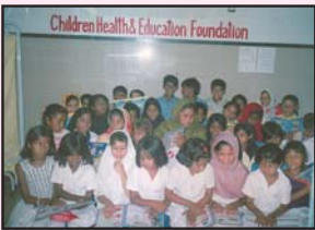
جوہر ٹاؤن لاہور ہیلتھ کیئر سینٹر میں شام کے وقت علاقے کے بچے تعلیم حاصل کر رہے ہیں