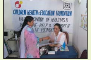
EBM ہیلتھ کیئر اور اسکول میں گائیکی کی ایکشن ڈاکٹر اور لوکل ہیلتھ سینٹر کی ڈاکٹر

E-mail: childrenhealth@chaef.org , karachi@chaef.org Web: www.chaef.org