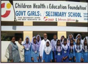
100 سالہ پرائمری اسکول شرفی کوٹھ گڑھی

ہمیں آپ کو بتاتے ہوئے خوشی محسوس ہوتی ہے کہ آپ کی زکوٰۃ اور مالی امداد سے غریب اور نادار مریضوں کو ہمارے ۳۹ مستقل اور موبائل ہیلتھ سینٹرز کے ذریعہ ۱۴۲ ملٹی، تعلیمی اور دیگر سہولیات فراہم کر رہی ہے۔ ملٹی سہولیات میں تشخیص لیبارٹری ٹیسٹ، الٹراساؤنڈ عورتوں اور بچوں کی مخصوص بیماریاں (MCH) اور دوائیوں کی مفت فراہمی شامل ہے۔ آٹھ سال کے مختصر عرصے میں CHAEF کے قائم کردہ مراکز سے ۸۳ لاکھ سے زیادہ غریب اور نادار مریض مستفید ہو چکے ہیں۔ اس کے علاوہ CHAEF کے قائم کردہ اسکولوں میں بچہ تعلیم کے علاوہ کمپیوٹر ٹینگ اور انگریزی زبان پر خصوصی توجہ دیکر ان غریب کچی آبادیوں کے بچوں کو بہتر اور کارآمد شہری بنانے کی کوششیں کی جاتی ہے۔ آپ سے گزارش ہے کہ CHAEF کو غریب اور ناداروں کو ملٹی اور تعلیمی سہولیات جاری رکھنے اور مزید سہولیات فراہم کرنے کے لئے دل کھول کر زکوٰۃ، خیرات، صدقہ کے ذریعہ مالی مدد فرمائیں۔