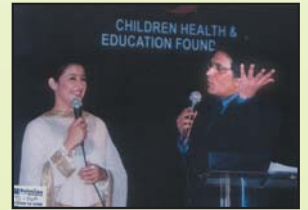
لیڈنگ مروجہ محترم اختر چلڈرن ہیلیتھ کے پروگرام میں انڈین مشہور اداکارہ نیشا کوازلہ کے ساتھ پروگرام ہوسٹ کرتے ہوئے