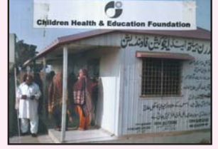
فیصل آباد پہلا پرائمری ہیلتھ کیئر سینٹر جو کہ 107 گاؤں کو میڈیکل سہولیات پہنچاتا ہے