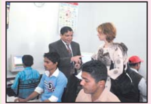
مسز کارلائل کمپیوٹر سینٹر کے دورے پر

Performance report of Children Health & Education Foundationsince September 2003 to june 30 th 2011 OPD Patients Male 1,738,514 Female 3,042,401 Children 3,911,658, Grand Total 8,692,573