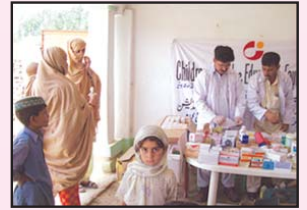
نوشیہ میں قائم MCH سینٹر