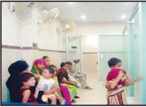
لاہور ممتاز ترین ہیلتھ کیئر سینٹر اسپتال جناب عظمت ترین پریوینٹس سلک پنک