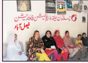
فیصل آباد گردنا تک پورہ میں MCH اور ہیلتھ کیئر سینٹر