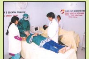
شیرین جناح کالونی میں پری فیمر کیلچر ویلتھ کیئر سینٹر میں پہلا آپریشن تھیٹر جہاں مختلف امراض کی سربری ممکن ہے