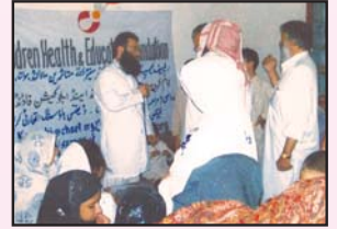
چارسدہ میں قائم پرائمری ہیلتھ کیئر سینٹر