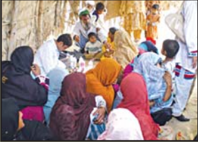
سندھ اور بلوچستان میں موبائل میڈیکل وین کی بدولت مختلف گاؤں میں میڈیکل سہولیات