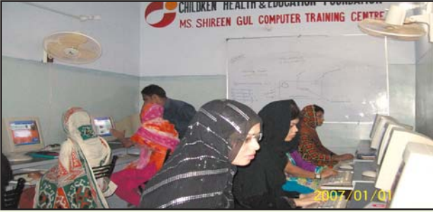
شاہ فیصل کالونی میں فری کمپیوٹر ٹریننگ سینٹر کا قیام 2009 میں کیا ہے۔