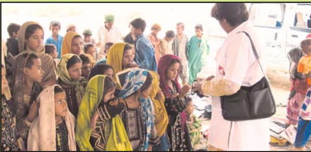
جمعہ گاہوں کے بچوں اور بچیوں کو صفائی اور بچوں کی بیماری کے بارے میں ڈاکٹر صاحبہ لیکچر دے رہی ہیں اب اسی جگہ چاف فٹ پاتھ اسکول کے لئے بلاک کا کمرہ بنوا رہے ہیں۔