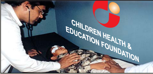
مریض کی آنکھوں میں شدید چوٹ لگنے کے بعد ڈاکٹر تفصیلی معائنہ اور فوری امداد کے بعد آنکھوں کے ہسپتال بھیجے کا مشورہ دے رہے ہیں۔