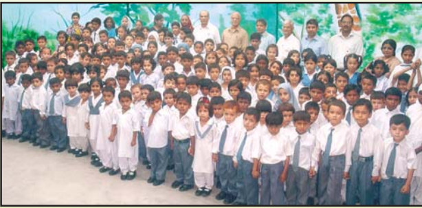
چاف کا گلستان جو ہر کراچی میں فری پرائمری اسکول اور کمپیوٹر ٹریننگ سینٹر۔