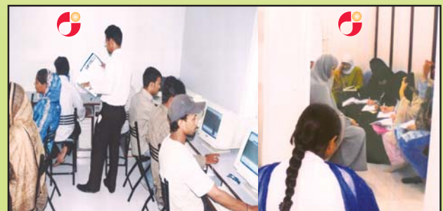
Computer Training & English Language Learning Centre at Qayumabad, Karachi.