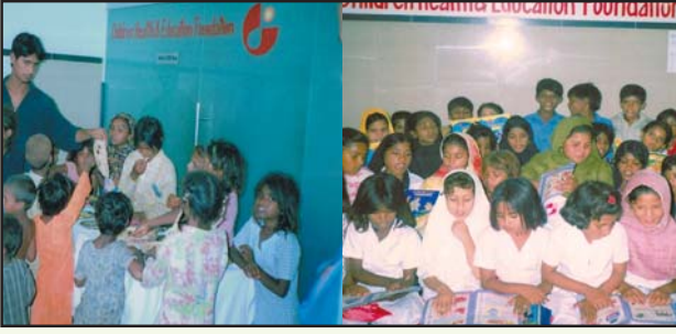
لاہور جو ہر ٹاؤن غریب بچے دو وقت کے کھانے کے ساتھ تعلیم حاصل کر رہے ہیں۔