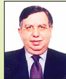
Mr. Shaukat Tarin Advisor to the Prime Minister on Finance and Economic Affairs

I admire all those people who are doing social work for the betterment of the condition of poor people. I appeal to all the kind hearted civil society members to help Children Health & Education Foundation who are doing such selfless social work for the poor and destitute people of Pakistan.