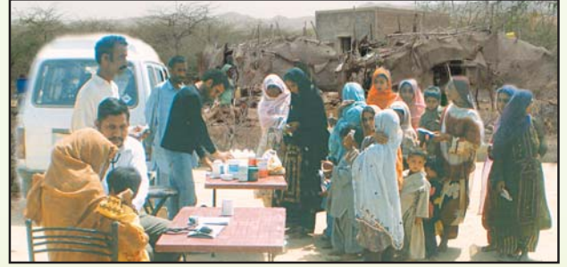
حب روڈ سے ہاکس بے جانے والے گاؤں میں موبائل ہیلتھ کیئر ویں کے ذریعہ غریب اور نادار مریضوں کے لئے روزانہ مفت علاج معالجہ اور دوائیوں کی کھولیات۔

Request sponsorship of FREE Medical support for 38 villages from HUB road to paradise point for the poor and destitute people of the area living without drinking water, electricity, Primary Health, Mother and Child Healthcare, Ultrasound and Laboratory tests.