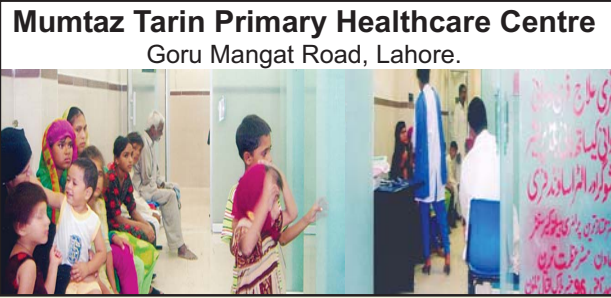
Mumtaz Tarin Primary Healthcare Centre Goru Mangat Road, Lahore.

ماشا اللہ چلڈرن ہیلتھ نے پچھلے ایک سال میں ٹوٹل 1.8 ملین امراض کا بالکل مفت علاج کیا ہے جس میں مفت تشخیص اور علاج 1,009,778 مریضوں کو اور ان کے 1,767,113 امراض کی مفت ادویات بھی فراہم کی ہیں جس میں 150,594 امراض نسواں اور حاملہ خواتین بھی شامل ہیں جب کے 67623 مریضوں کا مفت الٹراساؤنڈ اور لیباریٹری ٹیسٹ بھی مفت کرائے گئے۔ اور یہ سب آپ کی زکوٰۃ سے ہی ممکن ہوا آپ کے تعاون سے فاؤنڈیشن نہایت ہی قلیل عرصے میں 35 پرائمری ہیلتھ سینٹر قائم کر چکی ہے۔