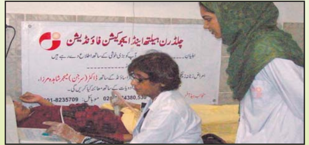
ماں اور بچے کی صحت کے پروگرام کے تحت حاملہ خاتون کا الٹراساؤنڈ ہو رہا ہے۔