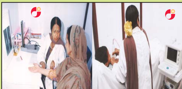
Photograph of Primary Healthcare, Mother & Child Health (MCH) Ultrasound, at B-30/2 Qayumabad, Karachi.

Inshallah 1000 such type of centres will be established all over Pakistan. This is not possible without your active support. I request you to please come forward and support the Children Health & Education Foundation.