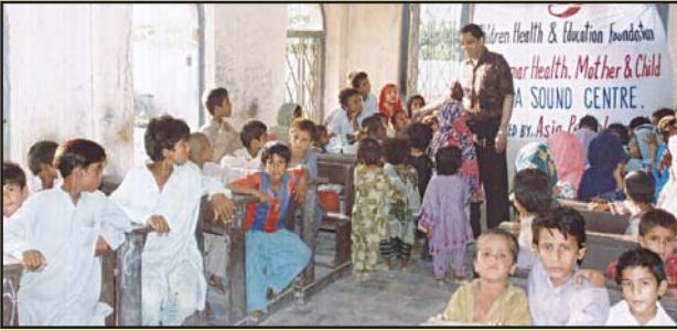
گوٹھ مولادادا کا اسکول جس کو چاف اسپانسر کر رہا ہے۔