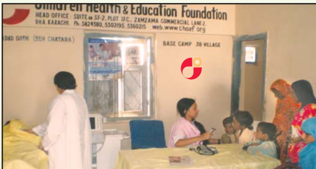
The Base Center at Moladad Goth 15 kilometers off Hub Road controlling 38 villages through Mobile Vans under outreach program at the junction of seven of 38 villages. The entire area does not have drinking water, electricity and medical facility.

We are pleased to inform you that during the year ended 30th June 2009 a total of 1.8 million diseases have been treated totally FREE, which included free consultation and diagnosis of 1,009,778 patients for their 1,767,113 diseases which included 150594 gynecological and pregnancy related while 67,623 ultrasound and laboratory tests were also conducted. All these services since 2003 to date were provided with the help of your zakat for treatment of a total of 5.6 million diseases. Besides, 405 students for computer & English learning training and 2050 students for primary education continue to receive the facility totally FREE.