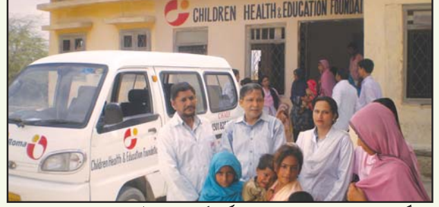
گوٹھ مولا داو، حب روڈ کے نزدیک مفت علاج کیلئے مرکزی پرائمری ہیلتھ سینٹر کا قیام جہاں علاج معالجہ ماں اور بچے کی صحت الٹراساؤنڈ اور لیباریٹری 38 گاؤں کو موبائل ہیلتھ ویں کو سپورٹ کر رہی ہے۔