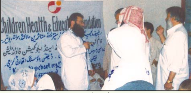
متاثرین مالاکنڈ ہموات کے لئے 6 موبائل میڈیکل کیمپ میں سے ایک قائم شدہ کیمپ مروان میں مریضوں کی خدمت کے لئے چلڈرن ہیلتھ ایجوکیشن فاؤنڈیشن کا عملدرن و رات معروف ہے۔